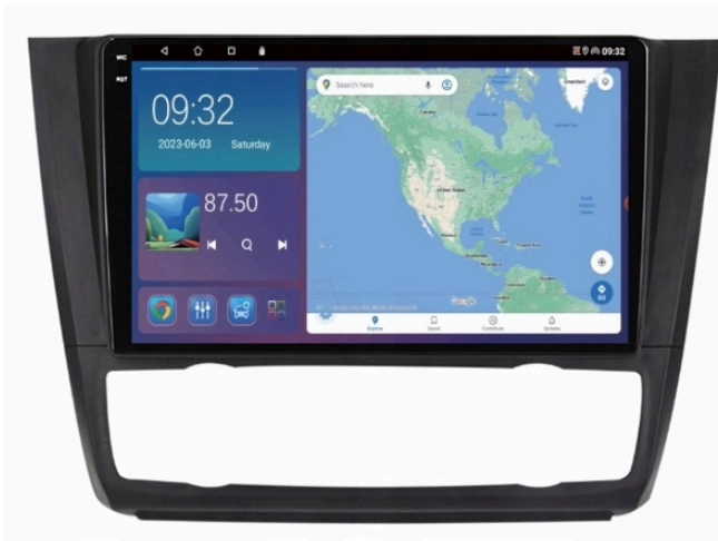
BMW SERIA 1 E81/E82/E87/E88 (2004-2013)