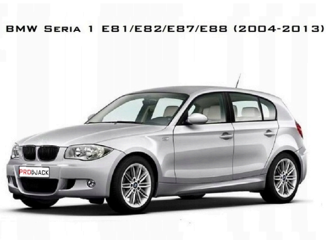
BMW SERIA 1 E81/E82/E87/E88 (2004-2013)