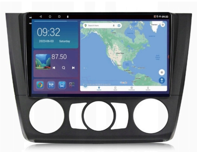
BMW SERIA 1 E81/E82/E87/E88 (2004-2013)