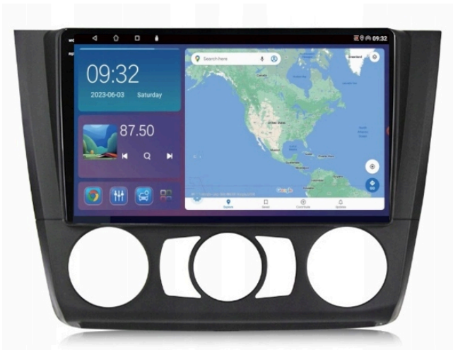
BMW SERIA 1 E81/E82/E87/E88 (2004-2013)